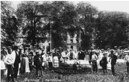
Dyrskue på Ridebanen 1908

en eskadron husarer blev indkvarteret i byen, og så blev Ridebanen en af deres øvelsesbaner. Staten har gennem alle årene ejet Ridebanen, og det er derfor Staten (nu Skov- og Naturstyrelsen), der afgør, hvad Ridebanen kan og må bruges til. Der er også begrænsninger som følge af, at Ridebanen og dens træer blev fredet i 1930'erne og fredningen revideret i 2001 i forbindelse med, at området blev renoveret, og de gamle træer erstattet af nye alléer.