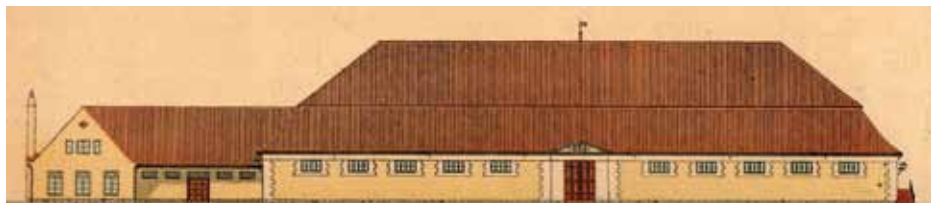
Skitse udarbejdet i 1939 i forbindelse med flytning af Ridehuset

rumme de danske kongers stutteri. Stutteriet havde hidtil været opstaldet på Esrom, men først i årene 1740-1745 blev der givet kongelig ordre til opførelse af et 4-fløjet kompleks, som skulle rumme stalde, administrationsbygning og gårde.