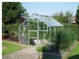
Julianas serier af hobbydrivhuse