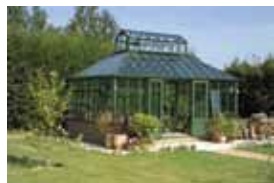
Gabriel Ash trædrivhuse

eller telefonisk til Hørsholm Egnsmuseum i kontortiden tirsdag – fredag kl. 10-14.